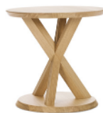
VOLKSHAUS SIDE TABLE 2024