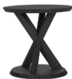
VOLKSHAUS SIDE TABLE Natur natural