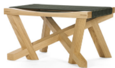
VOLKSHAUS STOOL 2024