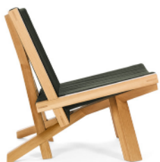
VOLKSHAUS LOUNGE CHAIR 2024